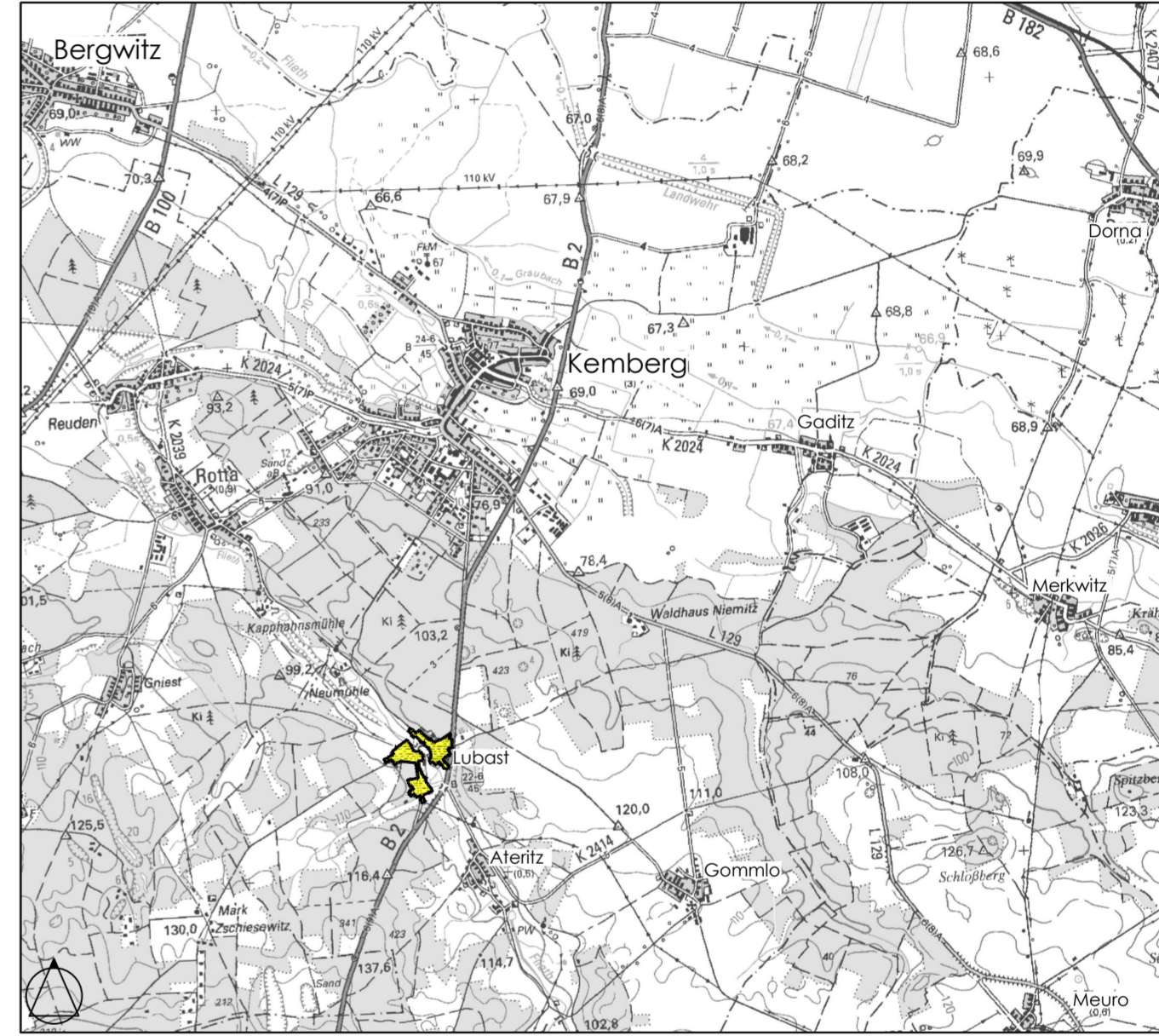
Top. Karte 1:50.000 Sachsen-Anhalt, ohne Maßstab Landesamt für Vermessung und Geoinformation Sachsen-Anhalt, Erlaubnisnummer: LVermGeo/A18-180-2010, vom 28.07.2010

*Anmerkung: Im Rahmen der Digitalisierung wurde beim Übertrag auf die aktuelle Kartengrundlage (Liegenschaftskarte) die Abgrenzung des Innenbereiches im Einzelfall redaktionell korrigiert. Die Urzeichnung der Satzung erfolgte auf einer Topografie-Folie der Liegenschaftskarte (Luftbild), Stand Frühjahr 1994, Hrsg. Katasteramt Lutherstadt Wittenberg.