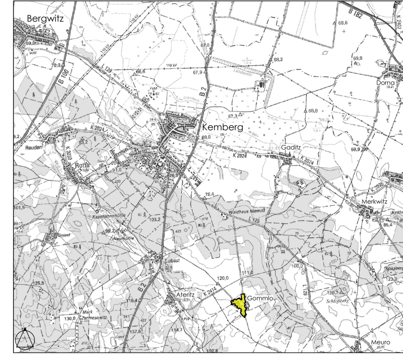
Top. Karte 1:50.000 Sachsen-Anhalt, ohne Maßstab Landesamt für Vermessung und Geoinformation Sachsen-Anhalt, Erlaubnisnummer: LVermGeo/A18-180-2010, vom 28.07.2010